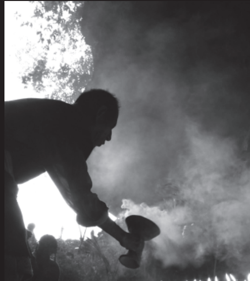
Corazón de cielo, corazón de la tierra Heart of Sky, Heart of Earth