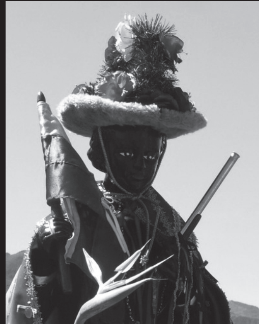
El misterio de las lagunas – Fragmentos Andinos The Mystery of the Lagoons, Andean Fragments

Som i en västernfilm börjar allt med en flykt. Fem tonåringar rymmer från