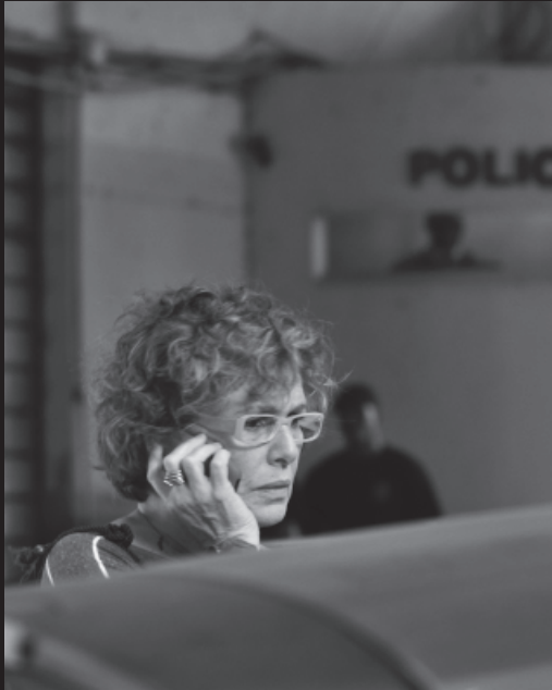
A memória que me contam Memories they told me