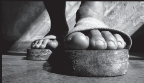
El Almanaque / The Calendar