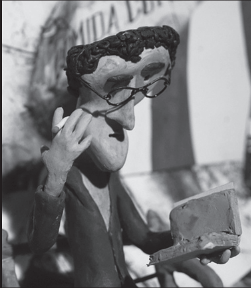
Roberto Bolaño – La batalla futura I

16.45 El limpiador / The Cleaner (Spelfilm, Perú)