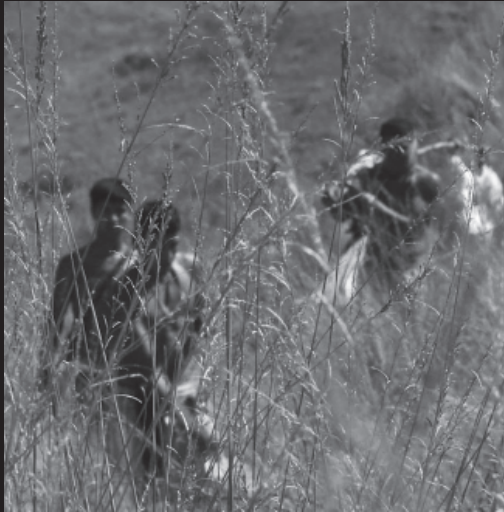
Los Salvajes / The Wild Ones