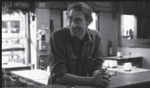
Rincón de Darwin / Darwin's Corner