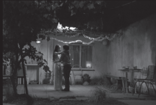
Infancia clandestina / Jag kallas Ernesto