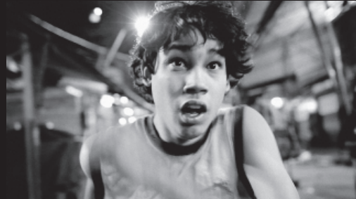
7 cajas / 7 Boxes

De träffande dialogerna och några mycket expressiva scener bygger snart upp berättelsen. Regissören målar upp huvudpersonernas upplevelser med stor uppfinningsrikedom medan några av Darwins tankar vävs in i berättelsen på ett underhållande och angeläget sätt.