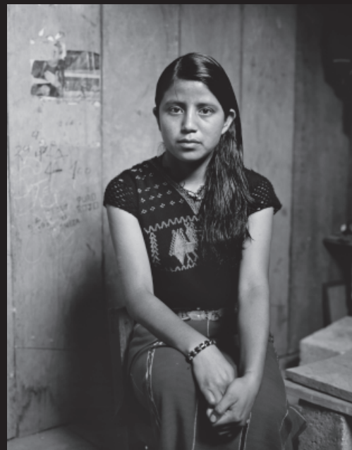
Granito - How to nail a dictator

I ett Argentina som är nedbrutet av diktaturen, lär sig Cecilia, sju år, att hon inte får avslöja sin verkliga identitet i skolan. Hon vänjer sig vid att låtsas och säga motsatsen av vad hon egentligen tycker. En dag skriver hon en uppsats på uppdrag av sina lärare, och får ett pris, direkt ur militärernas händer. De som antagligen också mördade hennes far.